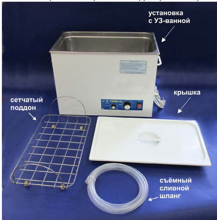
Рис.1. Внешний вид установки и комплект её поставки.

Слева от переключателя расположена ручка установки времени ультразвуковой обработки (таймер).