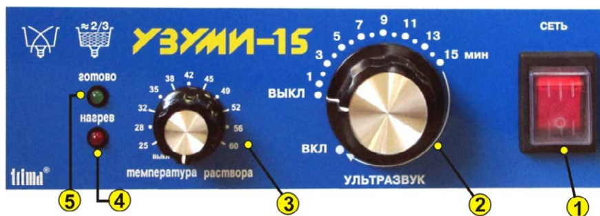
Рис.2. Панель управления установки "УЗУМИ-15".